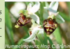
Hummelragwurz, Hrsg. C. Brüning