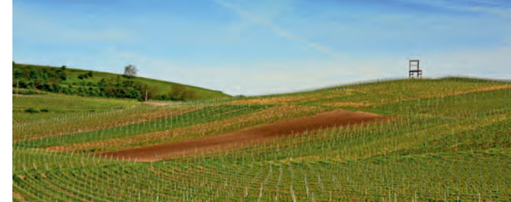
Gestühl bei Leiselheim