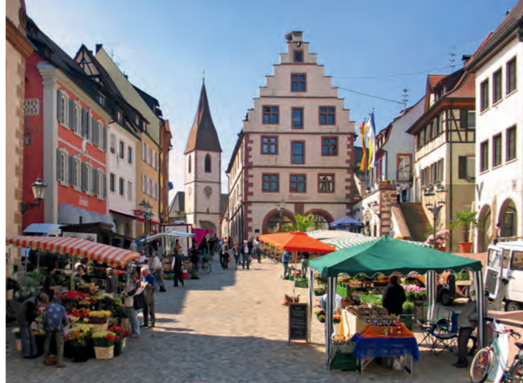
Edingen am Kaiserstuhl