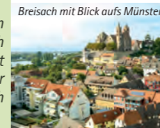
Breisach mit Blick aufs Münster